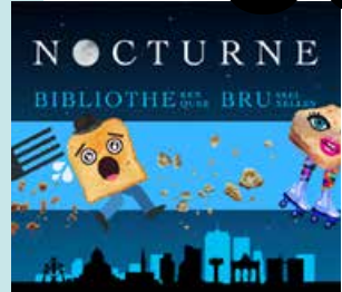
NOCTURNES DES BIBLIOTHÈQUES