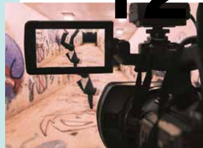
FRONT'HIER ET DEMAIN, UN PARI RÉUSSI!