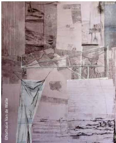
@Nathalie Van de Walle

Retrouvez le programme complet sur : www.stgillesculture.irisnet.be