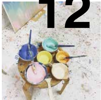
FOCUS JEUNESSE L'ART QUI RELIE